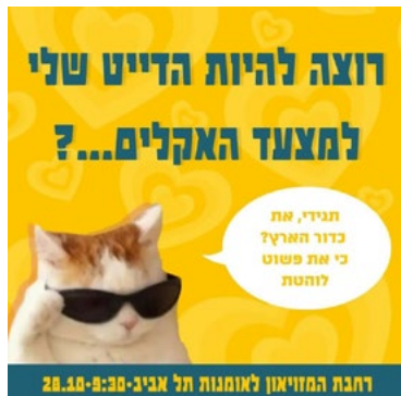
תרשים 3: צילום מסך של הפוסט "רוצה להיות הדייט שלי למצעד האקלים...?"

לדוגמה, בתרשים 3 מופיע פוסט שפורסם באינסטגרם לקראת מצעד האקלים שנערך ב־28 באוקטובר 2022, המשתמש בהומור כדי לשכנע בני נוער נוספים להגיע אליו. נעשה כאן ניכוס תרבותי - הן בשימוש במם של חתול במשקפיים (דימוי חזותי שהפך פופולרי במרחב המקוון, המדבר בשפת הפלטפורמה), והן בשימוש בביטויים מעולם הדייטים, היוצרים הזמנה הומוריסטית למצעד.