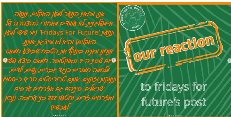
תרשים 8: פוסט התגובה לפעולות של טונברג והמחאה העולמית

התפתחות זו דרשה מהם לקיים משא ומתן מורכב בין העמדות שהתנועה העולמית ציפתה שיאמצו - התנגדות למלחמה בעזה כבר מימיה הראשונים - ובין עמדותיהם. הפעילים בסניף הישראלי החליטו לנסח תגובה משותפת לעמדה שנקטו טונברג והתנועה העולמית נגד מדינת ישראל ולהתעלמות שלהם מאירועי שבעה באוקטובר. את התגובה הם הפיצו ב־X ובאינסטגרם (תרשים 8), שם שיתפו אותה גם באנגלית, שכן היא הייתה מכוונת לחברי התנועה במדינות אחרות.