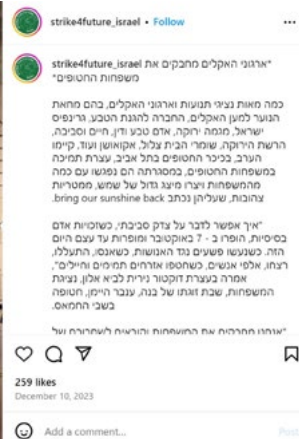
תרשים 7: פוסט באינסטגרם בעקבות המיצג לשחרור החטופים