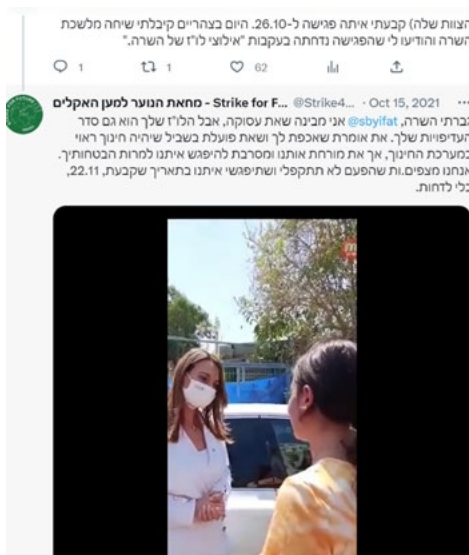
תרשים 5: הציוץ ב-X בעקבות הפגישה עם שאשא ביטון

מיומנות נוספת הקשורה ליצירה והפצה היא תיאום בין צוות דיגיטל לצוותים האחרים בארגון לשם השגת יעדים משותפים. לדוגמה, צוות קשרי ממשל ארגן הפגנה בכניסה לבית ספר שבו ביקרה שרת החינוך דאז ד"ר יעפת שאשא ביטון, במטרה לגרום לה לקבוע פגישה עם נציגי המחאה. השרה הסכימה, אך מסמסה את הפגישה. בתגובה, צוות הדיגיטל העלה ל-X ציוץ שכלל סרטון קצר, שבו נראית שאשא ביטון מבטיחה לאחת הפעילות שהיא תיפגש עם הנציגים (תרשים 5). לפי מורן (16), "זה היה אחד הציוצים עם הכי הרבה תנופה שהיה לנו במחאה בעצם [...] ובזכות זה אני חושבת שגם הם קבעו איתנו בסוף את הפגישה" (15.2.2023).