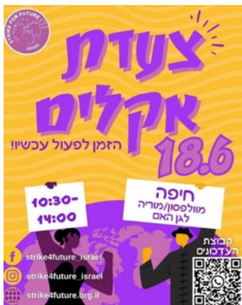
תרשים 6: פרסום לצעדת האקלים באינסטגרם

במהלך תהליך ההפקה של הפוסטים, חברי צוות הדיגיטל מפעילים שיקול דעת בנוגע להפצה, למשל לגבי מועד הפרסום . לדוגמה, כאשר הפעילים מארגנים פעולות מחאה מחוץ למרחב המקוון, הם בונים לוח זמנים להפצת הקמפיין ברשתות החברתיות, כדי לגייס פעילים נוספים ולמסור פרטים לוגיסטיים הנוגעים למועד ולמיקום של הפעולה. כך נעשה בפרסום צעדת האקלים שנערכה בחיפה בחודש יוני 2023 (ראו תרשים 6).