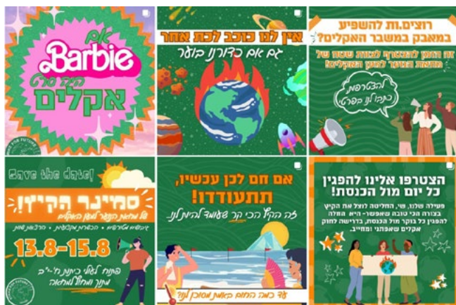
תרשים 2: צילום מסך מתוך עמוד האינסטגרם @strike4future_israel

בהיבט הטכני, הפעילים בתצוות העיצוב של אינסטגרם משתמשים באפליקציית קנבה (Canva) כדי ליצור פוסטים עם קו עיצובי אחיד, הכולל לרוב רקע ירוק וכיתוב כתום ולבן (צבעי התנועה העולמית). כמעט בכל פוסט יופיע סמל המחאה לצד דימויים חזותיים עוצמתיים, כגון כדור הארץ עולה באש, בני נוער מפגינים, או אנשים הסובלים מהחום הכבד (ראו תרשים 2).