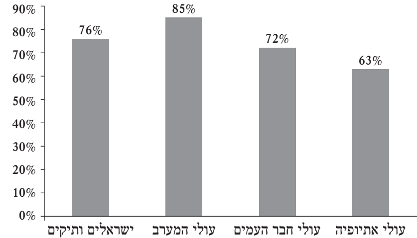
תרשים 1: שיעורי הנגישות לאינטרנט בשלושת החודשים האחרונים

פערים דיגיטליים בשימושים השונים: מלוח 1 להלן עולה כי שימושי האינטרנט הנפוצים ביותר בקרב כלל האוכלוסייה הם חיפוש מידע ושליחה וקבלה של דואר אלקטרוני, ואילו השימושים הפחות נפוצים הם קנייה מקוונת ותשלום חשבונות.