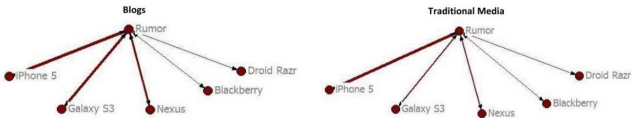
איור 2: ויזואליזציית רשתות: שמועות על מוצרים טכנולוגיים

התנהגויות החיפוש: בזמן שהחיפושים בשתי הקטגוריות הטכנולוגיות (Internet & Telecom Computers & Electronics/ הגיעו יחדיו לשיא (peak) בעקבות עלייה בסיקור החדשות, השיאים הפכו ליותר משמעותיים בקטגוריית ה-News search. כלומר, התנהגות חיפוש המידע הופיעה על ציר הזמן אחרי פרסום הסיפורים החדשותיים הבולטים. הגולשים עקבו אחר בולטות הנושאים והשתמשו ב-Google לקבלת מידע נוסף. ההסבר לכך יכול להיות שבתחום הטכנולוגי תלוי הקהל במומחים שיציגו את הנושאים ומכאן במה להתעניין.