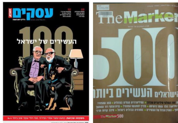
איור 1. שער יי 500 העשירים של דה מרקר, 2004, ויי 100 העשירים של מעריב, 2010

במחקר נעשה שימוש בניתוח תוכן תמטי ובניתוח שיח ביקורתי, אשר התמקדו בטורי הדעה של עורכי המוספים ובכתבות הפרופיל של עשרת המדורגים המובילים בכל מוסף מ"מוספי העשירים" (ראו איור 1) במעריב ודה מרקר . השיח במוספים מבטא אידאולוגיה ופועל ל"טבעון" שלה, באמצעות הצגת החברתי כטבעי (Koller, 2004). לפיכך ההנחה בבסיס שיטת ניתוח השיח הביקורתי היא כי הטקסט משקף את תפיסותיהם האידיאולוגיות של הכותב/הכותבים ובהתאם גם את התפיסות שהם מעוניינים לקדם (Hart, 2011). שאלות המחקר היו: כיצד מתוארים אילי ההון? מהן התכונות המיוחסות להם וכיצד מאופיינות התנהגותם ופעולותיהם? ומהם המנגנונים הדיסקורסיביים שבהם נעשה שימוש להבניית הדימוי של אילי ההון? באמצעות הניתוח התמטי, שנערך תוך איתור דפוסים חוזרים בטקסט